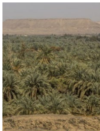
Suaheli für: Pflanze, Vegetation